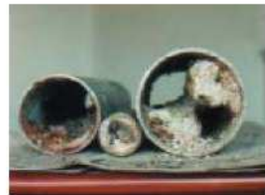
油の詰まった排水管