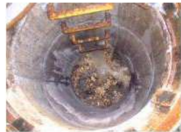
油の詰まったマンホール